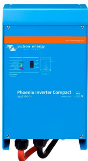
Inverter Compact 24/1600

Las posibilidades que ofrecen los inversores de alta potencia conectados en paralelo son realmente asombrosas. Para obtener ideas, ejemplos y cálculos de capacidad de baterías, le rogamos consulte nuestro libro "Energy Unlimited" (energía ilimitada), disponible gratuitamente en Victron Energy y descargable desde www.victronenergy.com.es .